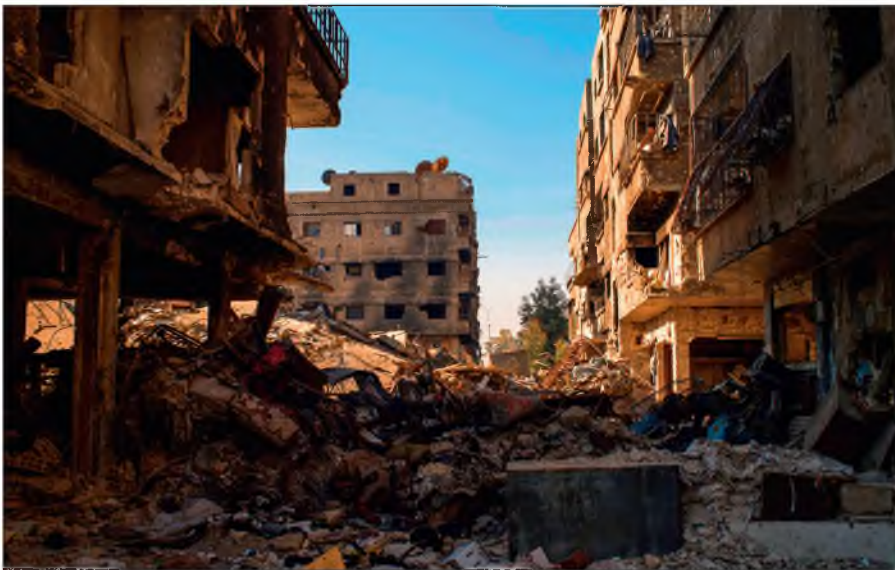
Разрушенный боевиками ИГИЛ Дамаск.

Террористы поставили на поток производство видеороликов с жестокими сценами казней пленников, заложников и «вероотступников». Эти материалы потом широко распространяются в социальных сетях и