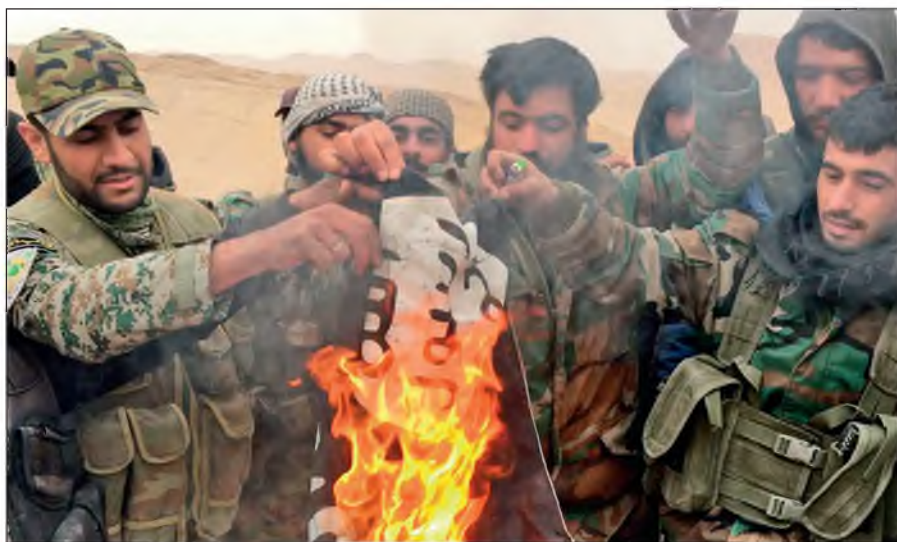
Народные ополченцы САР сжигают флаг ИГИЛ, снятый с отбитой у боевиков цитадели Пальмира.

Современное государство обязано защищать интересы каждого своего гражданина вне зависимости от его расы, национальности, принадлежности к определенной конфессии или религиозной традиции, в то время как ИГИЛ выражает интересы небольшой группы религиозных радикалов, жестоко подавляя остальную часть населения посредством запугивания, насилия и террора.