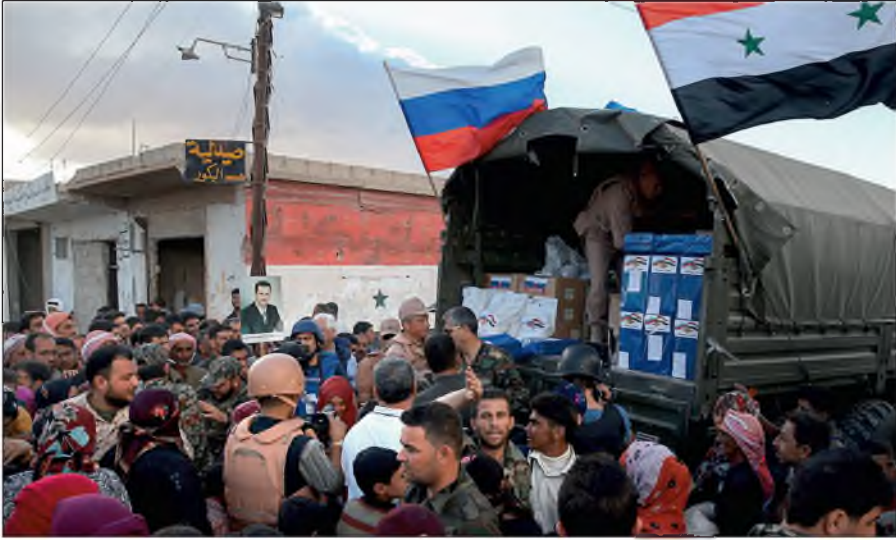
Россия оказывает гуманитарную помощь Сирии.