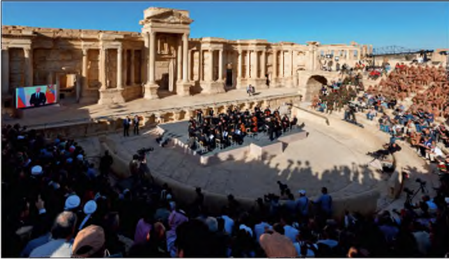
Освобожденная Пальмира. На концерте симфонического оркестра петербургского Мариинского театра под руководством народного артиста России Валерия Гергиева в Римском амфитеатре сирийской Пальмиры, освобожденной от террористов ИГИЛ.