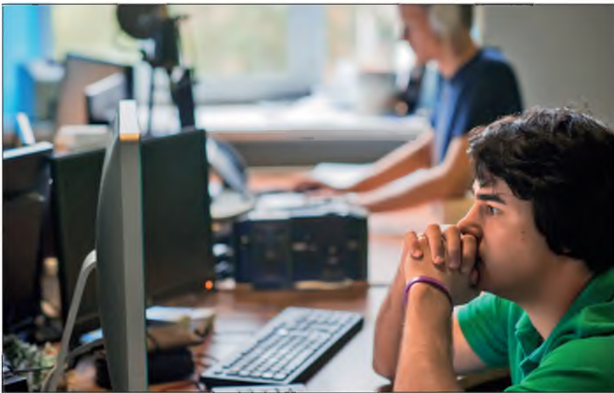
Постоянное присутствие вербовщиков ИГИЛ в соцсетях.

Активисты ИГИЛ поддерживают свои аккаунты в сетях Facebook, Twitter, Instagram, Friendica, Telegram. Активно они заявили о себе и в российских социальных сетях: «ВКонтакте» и «Одноклассниках».