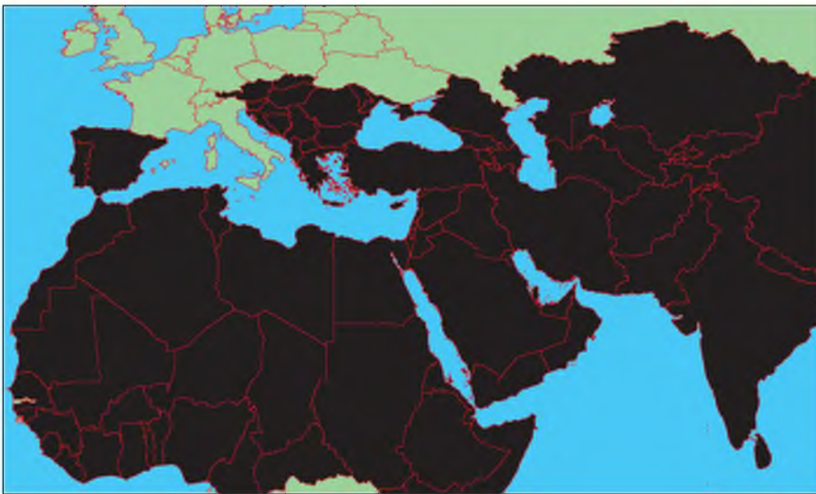
Карта мироустройства ИГИЛ

В настоящий момент группировка контролирует часть территории Сирии, а также ряд провинций в Ираке.