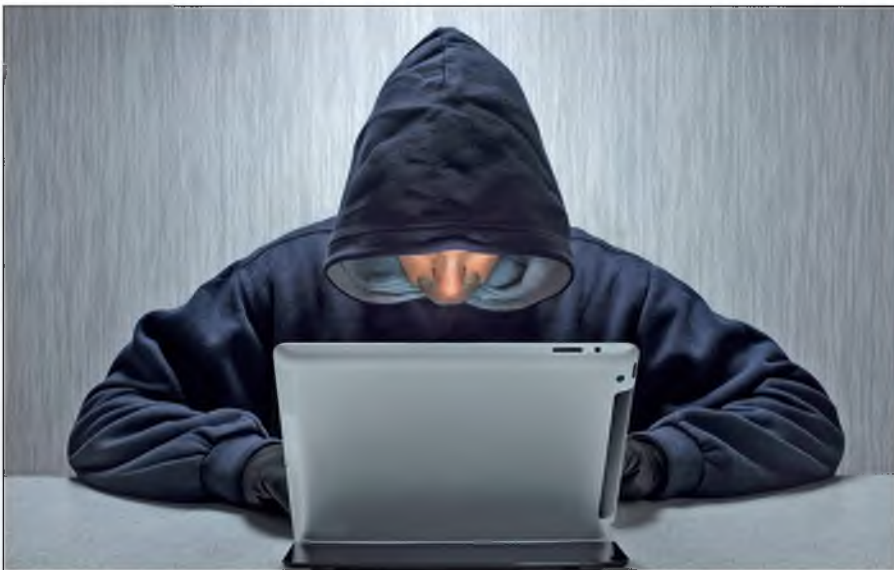
Вербовщики ИГИЛ активно используют Интернет.

Террористы день ото дня совершенствуют методы вербовки новых сторонников, а также алгоритмы их идеологической обработки. Читателю стоит помнить, что те типовые ситуации, которые описаны в данном пособии, можно рассматривать лишь в качестве базовых ориентиров,