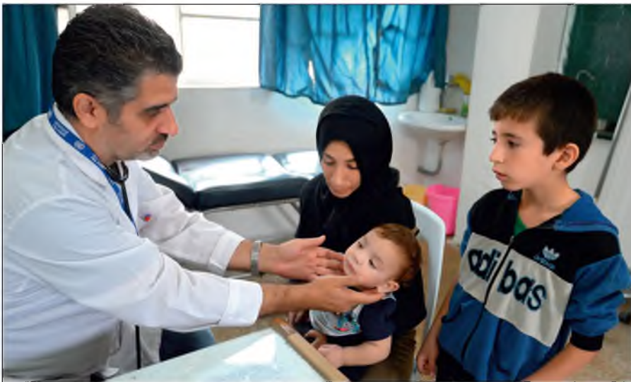
Истинный ислам призывает к состраданию и милосердию. Врач осматривает ребенка в медицинском пункте лагеря при одной из школ Дамаска.

Радикалы объявляют «врагами ислама» всех несогласных с ними мусульман. Ультрарадикальные группировки признают террор и насилие единственным способом достижения провозглашенных ими целей.