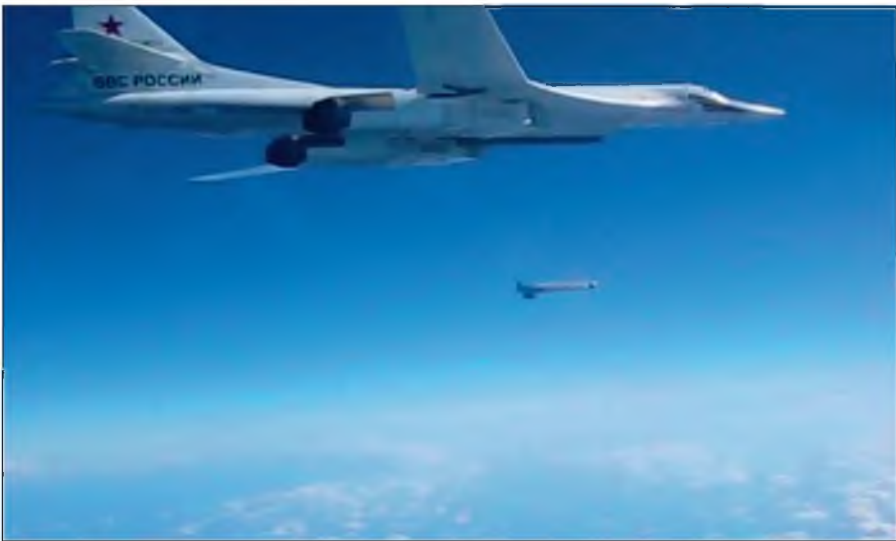
Воздушная операция российских ВКС по уничтожению боевиков ИГИЛ в Сирии.