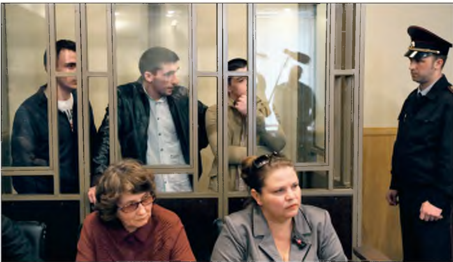
В Российской Федерации предусмотрена административная и уголовная ответственность за пропаганду идей терроризма, участие в деятельности террористических организаций.